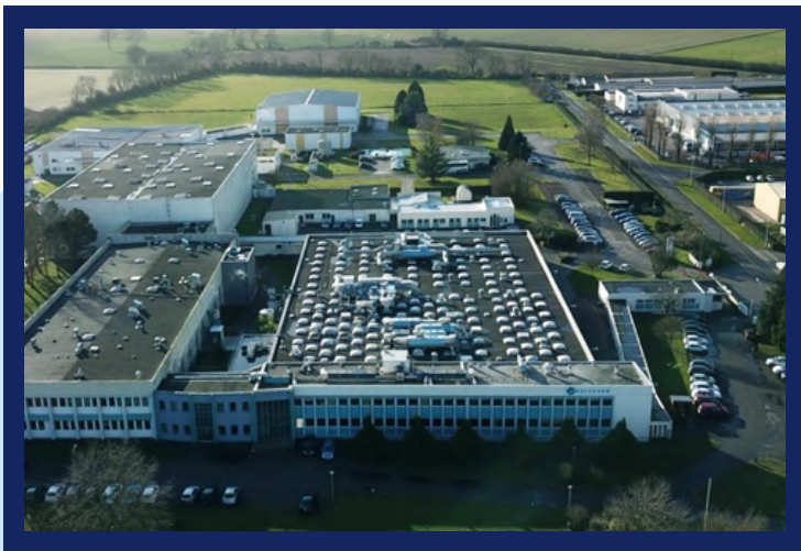
Une centaine d'entreprises ont choisi de s'installer au sein de la Zone Industrielle N°1 de L'Aigle

Secteurs clés : 1500 entreprises représentant près de 7 800 salariés spécialisées dans tous les domaines d'activités avec une dominante sur trois filières d'excellence, la métallurgie-mécanique, la filière du vivant et l'industrie chimique et plastique