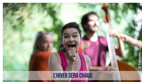
L'HIVER SERA CHAUD