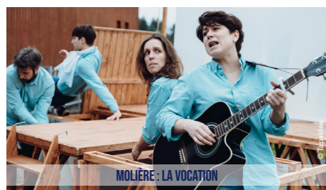
MOLIÈRE : LA VOCATION

Renseignements office de Tourisme : 02 33 24 12 40 Scannez le Qrcode pour visionner le programme détaillé