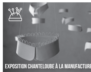
EXPOSITION CHANTELLOUBE À LA MANUFACTURE

Tel : 02 61 67 02 82 auprès d'Aurélié Bourges du service économie de la CdC