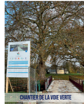
CHANTIER DE LA VOIE VERTE