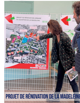
PROJET DE RÉNOVATION URBAINE DU QUARTIER DE LA MADELEINE