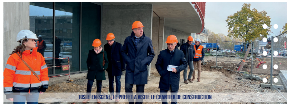
RISLE-EN-SCÈNE, LE PRÉFET A VISITÉ LE CHANTIER DE CONSTRUCTION

Parallèlement, les travaux de requalification du quartier de Verdun et d'aménagement des abords du complexe se poursuivent. L'avenue de Lattre de Tassigny sera rouverte à la circulation fin janvier si les conditions météorologiques restent favorables. Le montant de cette opération s'élève à 2,8 millions d'euros, subventionnée à 1,4 millions d'euros par l'État et la région Normandie.