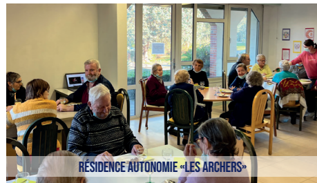
RÉSIDENCE AUTONOMIE «LES ARCHERS»