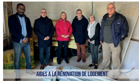
AIDES À LA RÉNOVATION DE LOGEMENT