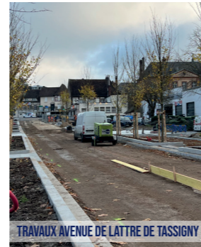
TRAVAUX AVENUE DE LATTRE DE TASSIGNY

La ville de L'Aigle finance 1,7 millions d'euros dans le cadre de ses compétences.