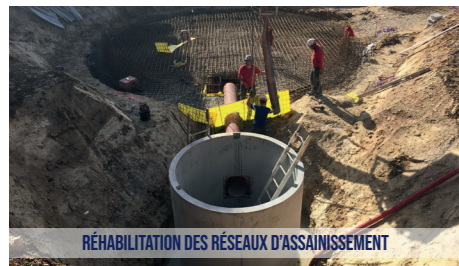
RÉHABILITATION DES RÉSEAUX D'ASSAINISSEMENT

Conjointement, la CdC poursuit son schéma directeur d'assainissement. Un premier état des lieux sera présenté prochainement. Cette étude permettra de structurer les investissements à réaliser pour les 10 années à venir.